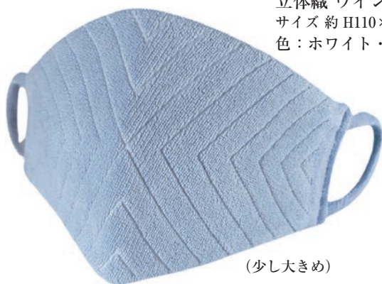
立体織 ウイング柄 ラメなし サイズ 約 H110×W220 色：ホワイト・ブルー