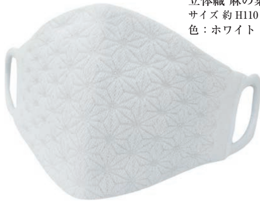
立体織 麻の葉柄 ラメ入 サイズ 約 H110×W200 色：ホワイト・ピンク

シルクのうるおいと 天然シルクから抽出された高純度シルクプロテインと 銀のパワーが融合 安全高品質抗菌性ナノ銀をマスク全体にコーティング