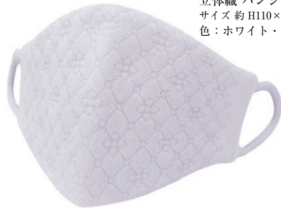
立体織 パンジー柄 ラメ入 サイズ 約 H110×W200 色：ホワイト・ピンク