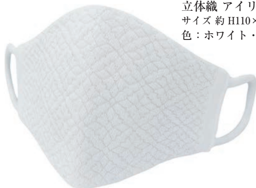
立体織 アイリス柄 ラメ入 サイズ 約 H110×W200 色：ホワイト・ピンク